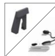
Sensori acc./spegn. Automatici

Le diverse lavorazioni dell'industria metalmeccanica (saldatura, molatura, sbavatura...) producono fumi e polveri che, se inalati, mettono a rischio la salute degli operatori. Per evitare che ciò accada occorre adottare misure che mantengano l'ambiente di lavoro sicuro e pulito. La prevenzione è un aspetto molto importante per raggiungere questo obiettivo, così importante da essere regolata da una severa normativa internazionale. I fumi di saldatura e le polveri di smerigliatura devono essere catturati in modo efficace, utilizzando prodotti professionali per l'aspirazione e la filtrazione. L'utilizzo di queste soluzioni crea uno stato di benessere nell'operatore che si riflette in un incremento di produttività e in ridotte assenze per malattia.